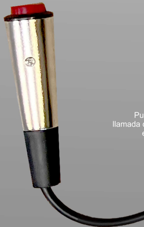
P156T Pulsador de llamada con cable en espiral