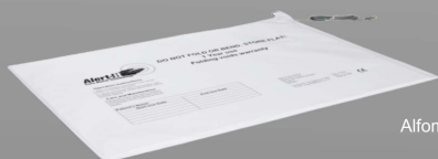
P143CB Alfombra pequeña para cama