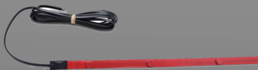
P143GAB Tira-sensor 80 cm para cama (bajo el colchón)