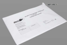
P149A Alfombra avisadora para silla