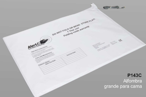
P143C Alfombra grande para cama

La medida de la tira sensor para silla es de 40 cm .