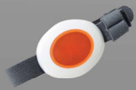
P135E Pulsador aviso

El detector de presencia ALERT-IT permite monitorizar a los pacientes de una habitación, detectando si alguno de ellos se ha movido. Puede colocarse en diferentes lugares de la habitación (pared, a ras de suelo, etc.), de tal manera que es posible configurar el dispositivo para que detecte diferentes tipos de movimientos.