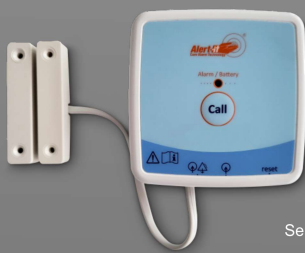
P163AA-D Sensor avisador para puerta

Los pulsadores ALERT-IT permiten al usuario enviar una señal de aviso al cuidador simplemente apretando el pulsador. En el caso del modelo anticaída, además de la función de aviso, el pulsador es capaz de detectar si el usuario se ha caído y de mandar en ese caso una señal de aviso al cuidador.