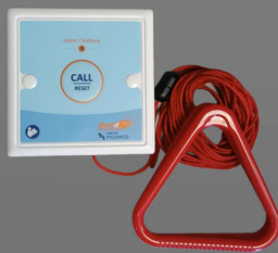
P209A Tirador aviso emergencia cuarto de baño

El sensor avisador para puerta permite detectar cuándo un paciente está intentando salir de su habitación. Una vez abierta la puerta, el sensor envía una señal al receptor del cuidador para que éste acuda.