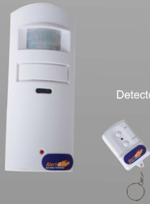
P162B Detector de presencia

El detector de presencia ALERT-IT permite monitorizar a los pacientes de una habitación, detectando si alguno de ellos se ha movido. Puede colocarse en diferentes lugares de la habitación (pared, a ras de suelo, etc.), de tal manera que es posible configurar el dispositivo para que detecte diferentes tipos de movimientos.