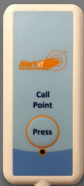
P176B Pulsador de llamada